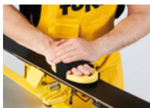
Base Brush oval Nylon